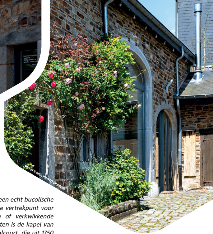
PBWW © RITA PHOTOGRAPHIE