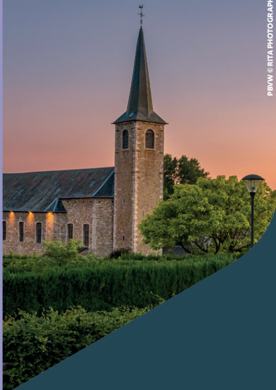
PBWW © RTA PHOTOGRAPHIE