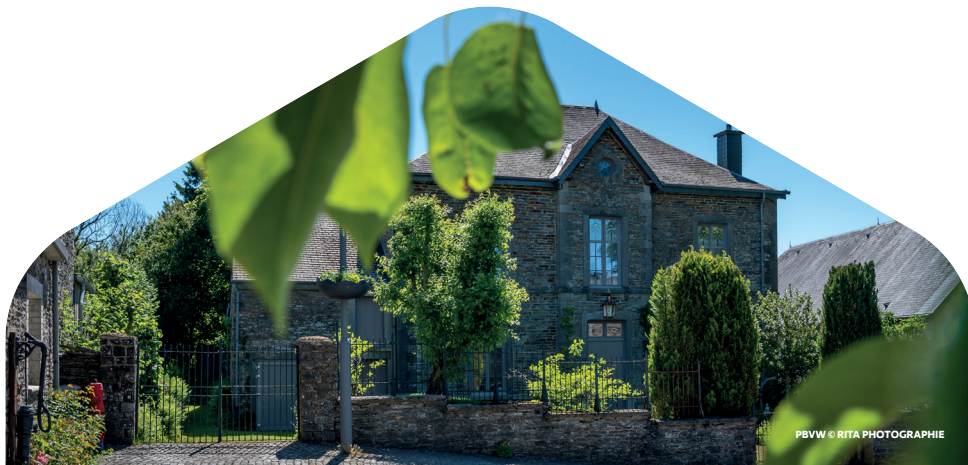
PBWW © RITA PHOTOGRAPHIE