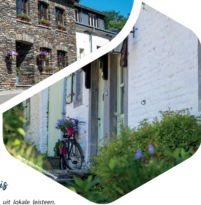
PBW 6 RITA PHOTOGRAPHIE