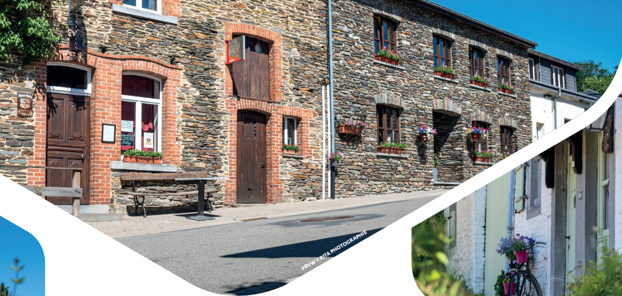
PBW 6