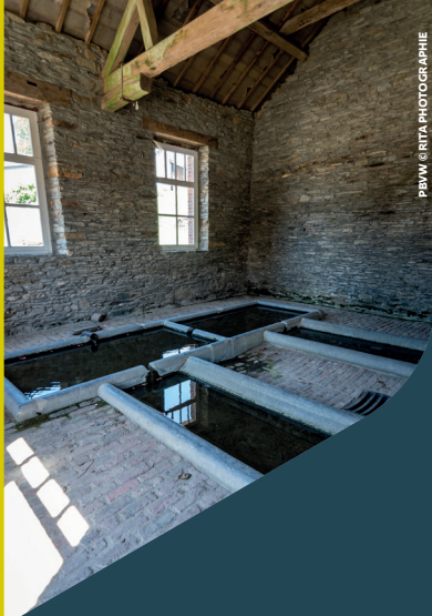
PBWW © RTA PHOTOGRAPHIE