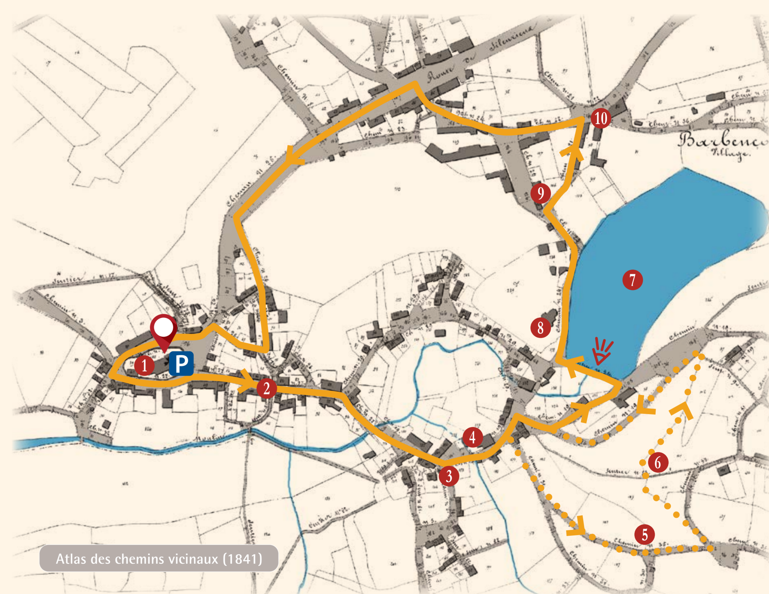
Atlas des chemins vicinaux (1841)