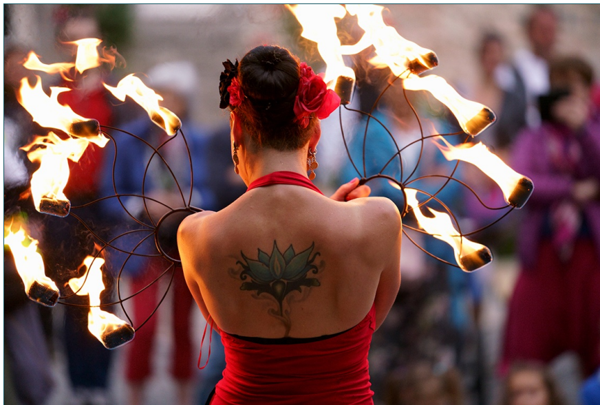
Nuit Romantique - Thon-Samson - Un des Plus Beaux Villages de Wallonie