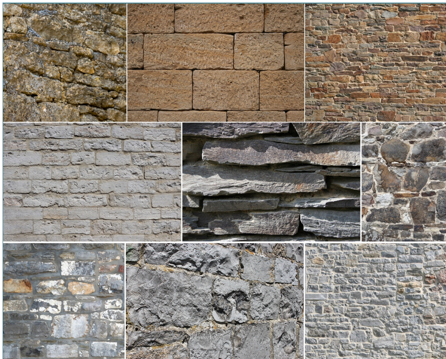
Les types de pierre dans nos Beaux Villages (de gauche à droite et de haut en bas : Calcaire bajocien appareillé ou non en Lorraine - Grès en Condroz - Pierre de Gobertange en Hesbaye - Schiste en Ardenne - Pierre de Poudingue en Fagne-Famenne (Wéris) - Calcaire en Pays de Herve et en Condroz)