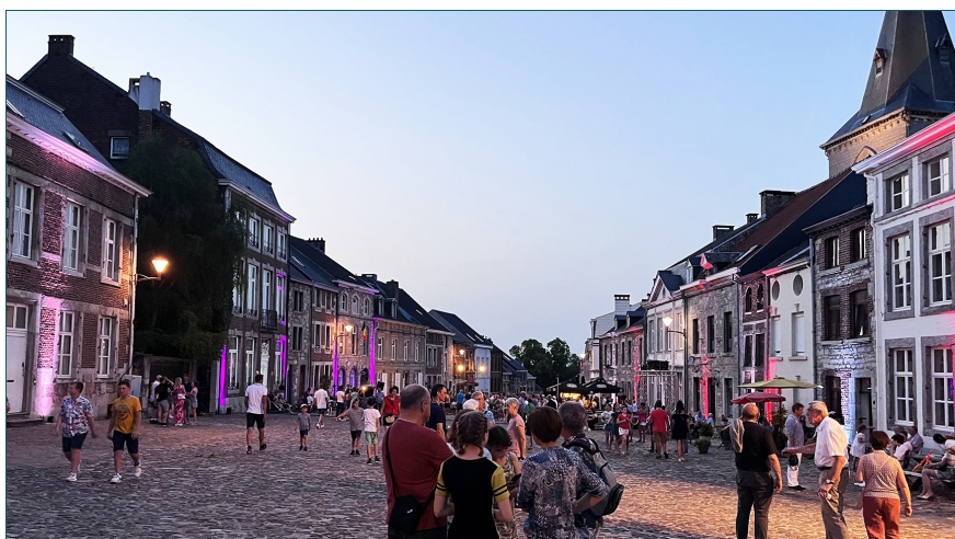
Place Saint Georges à Limbourg - Un des Plus Beaux Villages de Wallonie