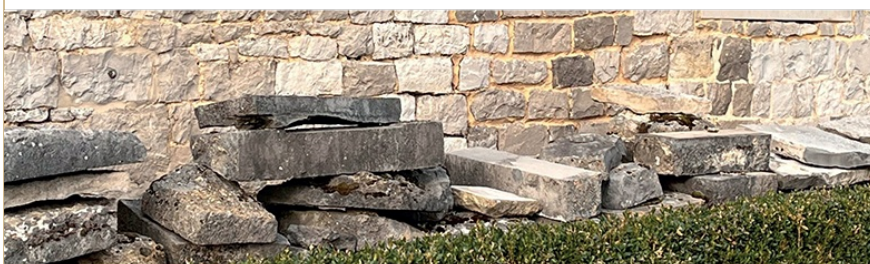
TABLE RONDE COORGANISÉE PAR LA MAISON DE L'URBANISME DES PLUS BEAUX VILLAGES DE WALLONIE ET L'ASSOCIATION PIERRES ET MARBRES DE WALLONIE

Défi majeur pour le secteur de la construction, Modèle économique basé sur une gestion plus durable et circulaire des matériaux, Thématique liée à la préservation du patrimoine bâti d'hier, Le réemploi est au cœur de nos préoccupations de demain !