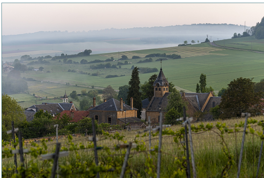
Torgny - Un des Plus Beaux Villages de Wallonie