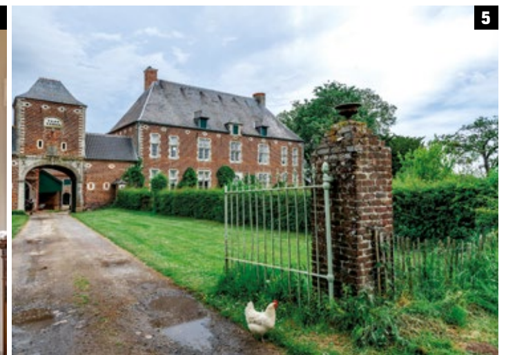
1. Vue aérienne du village avec, de gauche à droite, la cure, l'église et la cense du seigneur. 2. La très belle ferme située au n° 16 de la rue des Beaux Prés. 3 et 4. Le mobilier de styles Louis XIV et Louis XV de l'église de Mélin. 5. La ferme d'Awans.