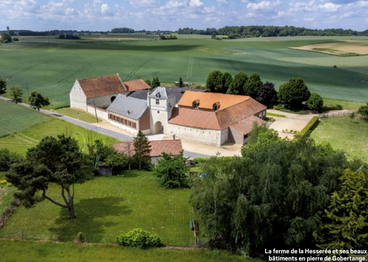
La ferme de la Hesserée et ses beaux bâtiments en pierre de Gobertange.