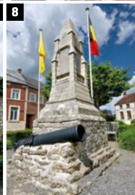
1, 2 et 3. La cure. 4. La ferme Fortemps. 5 et 6. La cense du seigneur. 7. L'église du village abrite un orgue classé datant de 1724. 8. Le monument aux morts de la Première Guerre mondiale.