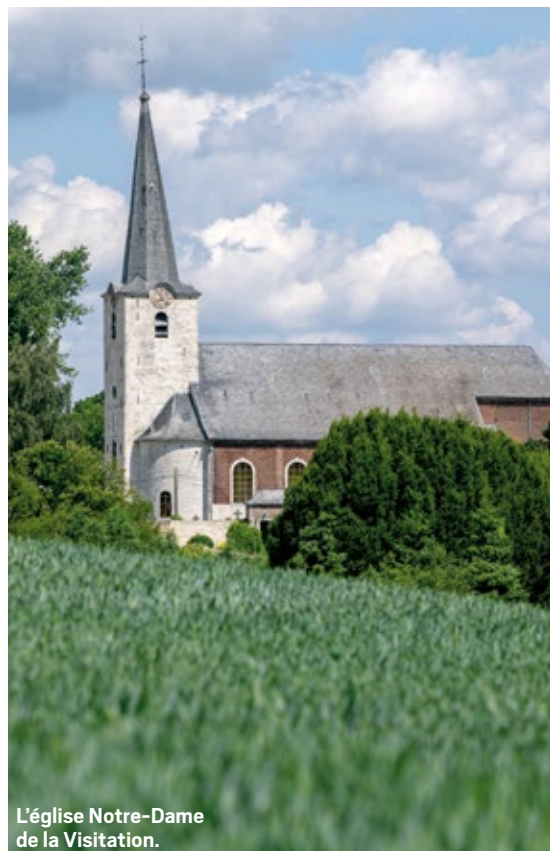
L'église Notre-Dame de la Visitation.

■ Nous ne pourrions citer toutes les fermes, mais Mélin fait un peu figure d'exception dans la commune de Jodoigne. Surnommé «le village blanc», il abrite plusieurs très belles exploitations, parmi lesquelles l'ancienne cense du seigneur, sise au n° 4 de la rue des Beaux Prés. Cette ferme évoque la seigneurie de Mélin, créée en 1284 par le duc de Brabant. Le manoir actuel, érigé en 1568, a été restauré et amputé de dépendances après deux incendies survenus en 1736 et 1855. Il prend la forme d'un quadrilatère comprenant l'ancien logis et les dépendances agricoles. La cense a été édifée intégralement en pierre de Gobertange. L'ordonnance actuelle des façades de l'ancien logis remonte à la fin du XVI e siècle et participe à l'esprit traditionnel de l'architecture rurale de l'époque. Elle héberge de nos jours un gîte rural, point de départ idéal pour une découverte de la région. La rue des Beaux Prés abrite encore, aux n°s 16 et 24, une ferme en U et une autre tricellulaire, toutes deux reprises à l'inventaire du patrimoine immobilier culturel.