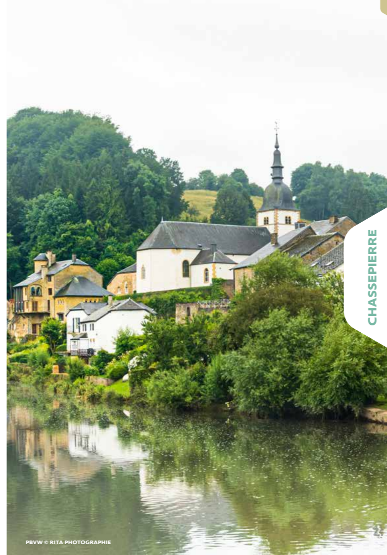
PBVV © RITA PHOTOGRAPHIE

Chassepierre dankt ongetwijfeld zijn naam aan de twee Latijnse woorden « Casa Petra » die « Stenen huis » betekenen. Het lief-tallige dorp Chassepierre, een paradijs voor schilders, vertoont een opmerkelijk architecturaal ensemble: talrijke huizen uit de 18 de en 19 de eeuw, de Sint-Martinuskerk en zijn begraafplaats, de pastorie, en de banmolen. De kerk, uit 1702, is opgericht in het midden van het oude kerkhof; de toren heeft een barok uiteinde. De pastorie die ernaast ligt dringt zich op door haar volume. Aan de achterkant overheerst het twee alleraardigste huizen uit de 18 de eeuw gebouwd op de oevers van de Semois. « Le Trou des Fées » (het feeëngat) lager gelegen dan de kerk, is een netwerk van ondergrondse galerijen, door de mens in de kalkrots (cron) gegraven. Ze lopen verder onder de funderingen van de oude molen naar de pastorie waar ze in de kelders uitmonden. De molen is zo ingericht dat culturele evenementen zoals theater - en muziekvoorstellingen mogelijk zijn. De weg Florenville-Bouillon loopt een vijftigtal meter boven het dorp Chassepierre en biedt een prachtig panorama op één van de mooiste bochten van de Semois en op de eerste steile cuesta. Elke zondagmorgen: boerenmarkt in het centrum van het dorp. ●