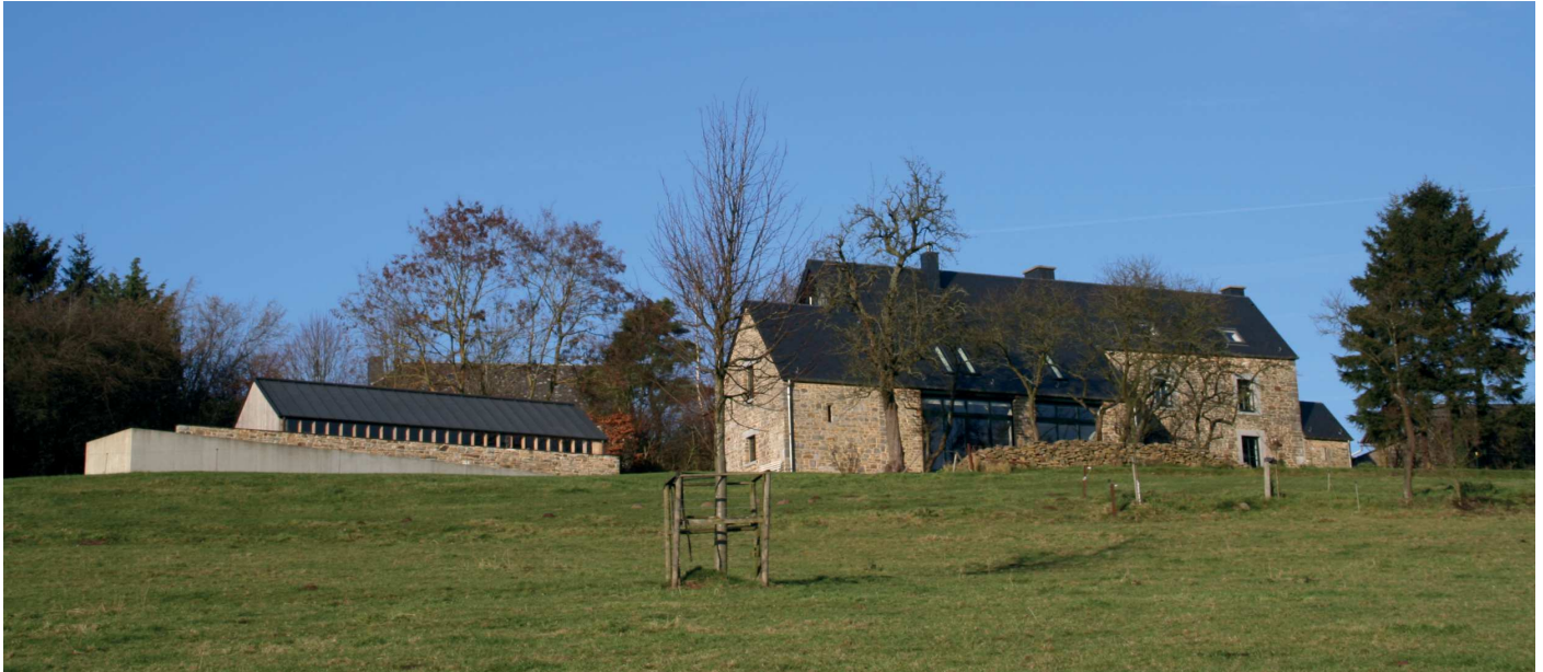
Silhouette de l'ensemble et rapport du site.

en habitation, construction d'un hangar agricole et d'un bassin