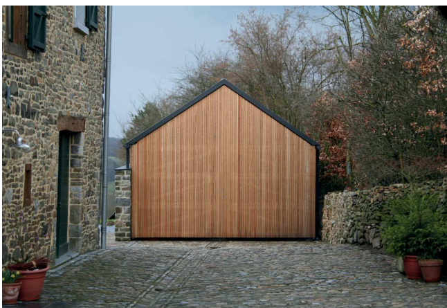
Entrée du hangar. Vue à partir de la voirie. Unité et contraste des matières

Au-delà d'une amélioration remarquable des conditions de vie dans le bâtiment principal, par le percement de baies imposantes en versant ouest (ouverture sur un cadre paysager de grande valeur, prise de lumière,...), le projet dans son ensemble participe efficacement à une valorisation esthétique du cadre bâti et paysager :