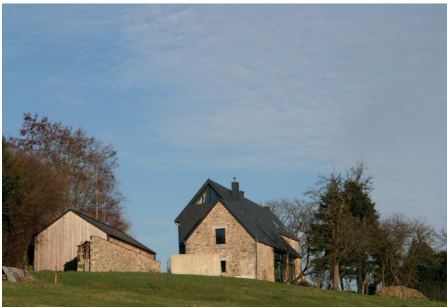
Traitement des pignons. Volumes en relation.